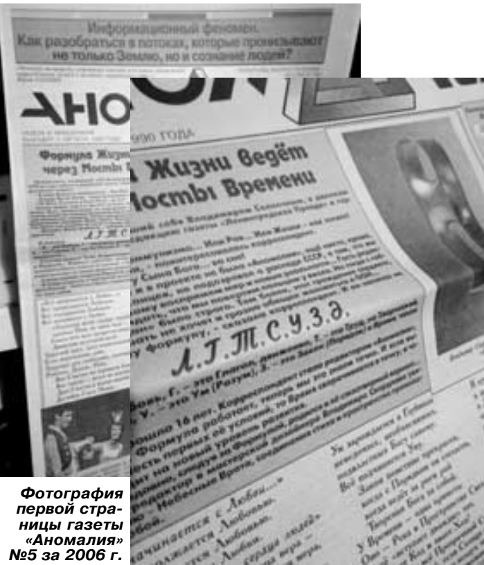
Фотография первой страницы газеты «Аномалия» №5 за 2006 г.