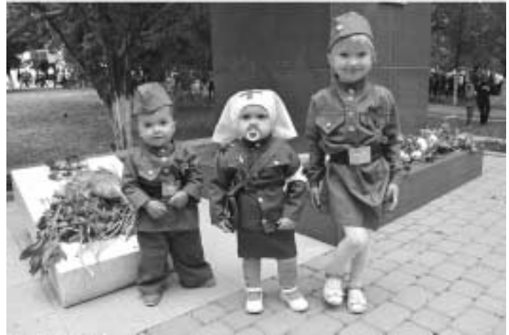
На этой потрясающей фотографии Тройной смысл планетарного воскрешения! Кто пойдёт вперёд после нас, кто защитит родную планету? Автор этого фото увидел глубинный процесс планетарного преобразования в День Победы. (Фото – 8 мая 2018г. Разместила Галина Тюрина на страничке в www.facebook.com – Цените жизнь – она одна!)

Каждый год мы наблюдаем за явлением, которое происходит 9 мая, «Безсмертный Полк» собирает огромное количество людей на улицах городов России, а теперь и всего мира планеты Земля.