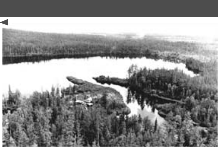
Предполагаемое место в тайге в районе реки Подкаменная Тунгуска, куда 80 лет назад (30 июня 1908 г.) упало огненное тело, названное Тунгусским метеоритом.