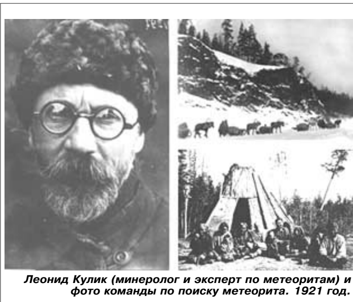
Леонид Кулик (минеролог и эксперт по метеоритам) и фото команды по поиску метеорита. 1921 год.