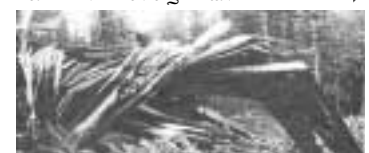
Рис. 1 Вывал: выворот с корнем. 60-е гг.