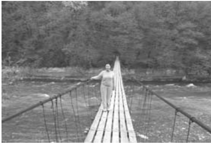
(Тая на мосту)

(последняя буква была не Э, скорее замкнутый завиток, как транскрипционный знак «а» в английском «тар»)