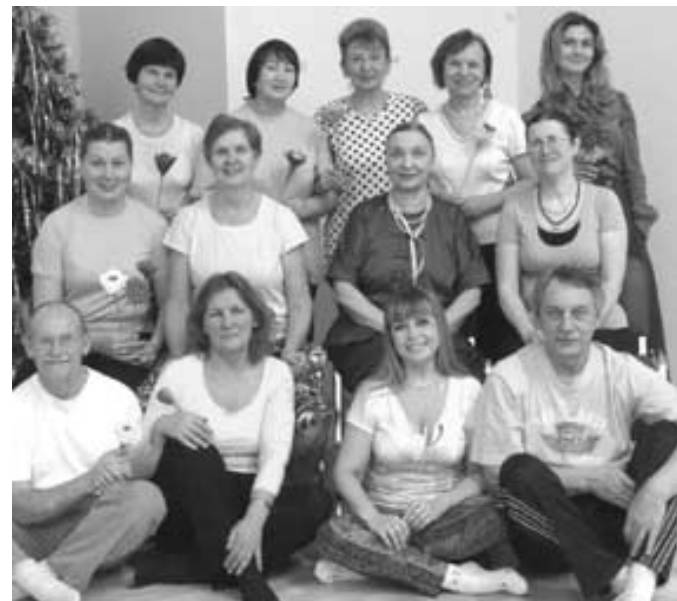
На фото: Группа Пластики здоровья встречает Новый 2016-й год.